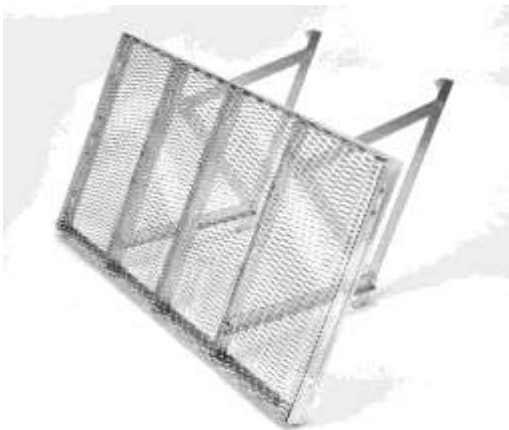
写真3. デコメッシュ置くだけタイプ DM 5-100S