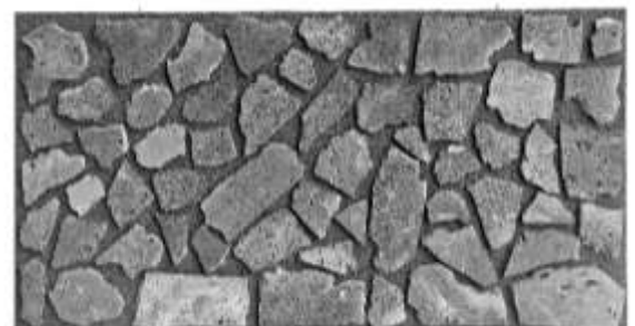
写真4. デコメッシュ石貼りタイプ LS5-100